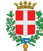
Comune di Vicenza